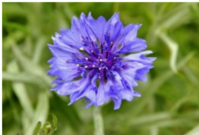
Bleuet Centaurea cyanea