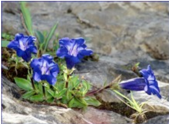
Gentiana kochiana - Gentiane de Koch