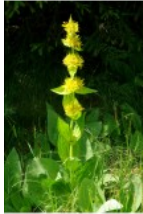
Gentiana lateralis - Grande Gentiane